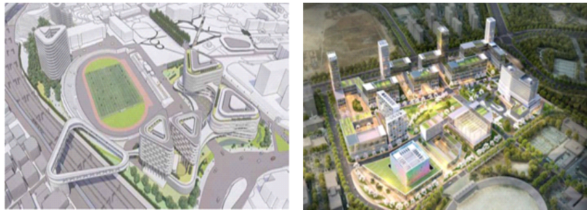
[한남대 캠퍼스 혁신파크 조감도(좌), 한양대 에리카 캠퍼스 혁신파크(우)]

산업단지 지정에 맞춰 대학도 캠퍼스 혁신파크의 가시적인 성과 창출과 효율적인 사업 운영을 위한 중장기 발전 전략을 수립했다.