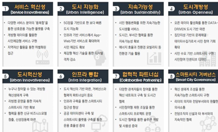
[대구 스마트시티 핵심 키워드]

스마트도시계획 수립을 위해 우선 국내·외 및 대구의 도시 여건을 진단하고, 시민의 바람과 미래, 이슈 및 발전 여건 등을 분석했다. 스마트시티의 핵심 키워드는 ① 서비스 혁신성, ② 도시 지능화, ③ 지속 가능성, ④ 도시 개방성, ⑤ 도시 혁신성, ⑥ 인프라 통합, ⑦ 협력적 파트너십, ⑧스마트시티 거버넌스로 선정선정했으며, 삶터와 일터가 행복한 스마트 대구를 위해 시민공감도시(체감형 서비스 구축, 시민참여 확대), 기업상생도시(비즈니스 모델 창출, 첨단산업 환경 조성), 공간혁신도시(디지털 전환, 공간배치 혁신) 등을 목표(추진전략)로 제시했다.