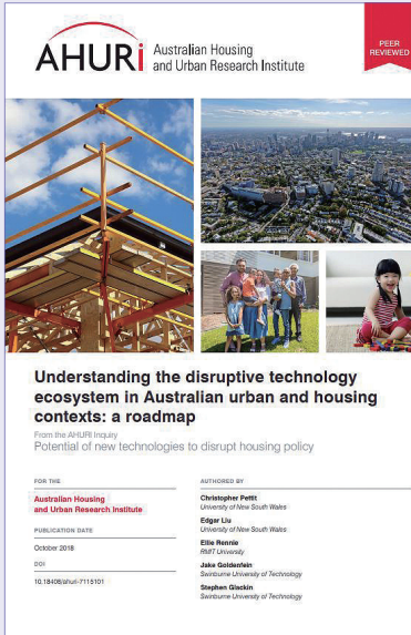
도시 분야 발간물 예시