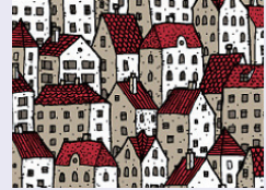
주택 및 경제