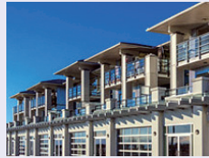
민간 임대 시장