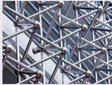
세금 및 주택 정책