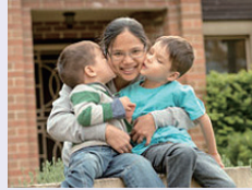
주거지원 및 사회정책