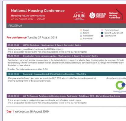
2019 National Housing Conference