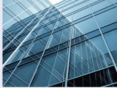
주택 포부와 경력