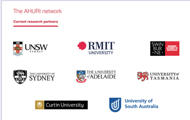
AHURI 네트워크의 연구 파트너

이와 같은 AHURI의 연구 성과는 AHURI와 호주 대학들과의 연계·협력이 뒷받침되었기 때문에 가능하였다. AHURI는 주택 및 도시 분야의 전문가를 양성하는 일을 지원하기 위하여 NHRP를 통해 대학 측에 장학금과 박사 후 과정 등을 제공하고 있으며, 대학은 주택 관련 새로운 아이디어를 발굴하고, 주택 연구 보고서 작성과 정책 수립에 참여하고 있다.