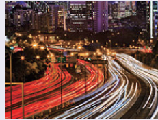
도시 계획 및 주택